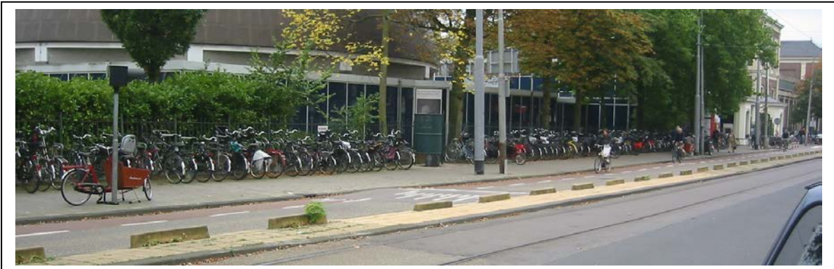
Plantage Kerklaan: tekort aan fietsparkeerplekken voor Artis

In het weekend schiet de parkeerruimte voor fietsen bij Artis tekort, mede als gevolg van de grote aantallen bakfietsen. Tegelijk met de voorgenomen aanleg van een parkeergarage voor auto's zal uitbreiding van de fietsparkeervoorzieningen gerealiseerd moeten worden.