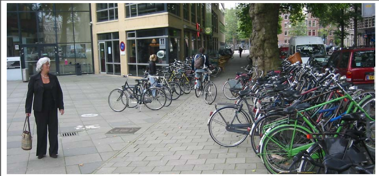
UvA Roetersstraat: het tekort aan fietsparkeerplekken op korte afstand is deels oplosbaar door slimme plaatsing van fietsenrekken op het kale pleintje voor de hoofdentree.