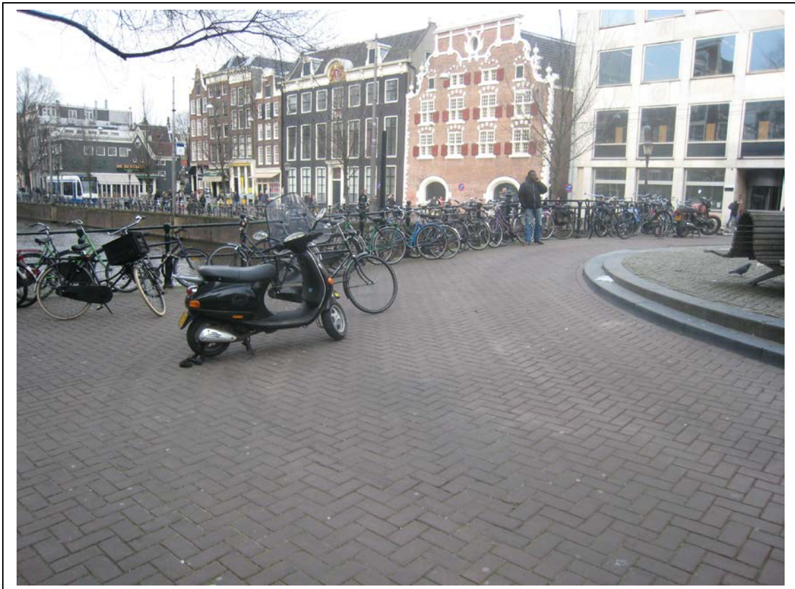
Koningsplein: in deze hoek is nog ruimte voor fietsenrekken. De drukke looproutes aan de andere kant van het plein raken verstopt.

Op het Koningsplein bestaat een chronisch gebrek aan fietsparkeerplaatsen voor UB-gebruikers en winkelbezoekers van Heiligeweg/Kalverstraat en Koningsplein/Leidsestraat. Op de hoeken van de grachten en op de brug over het Singel achter de ronde banken is ruimte voor extra fietsenrekken.