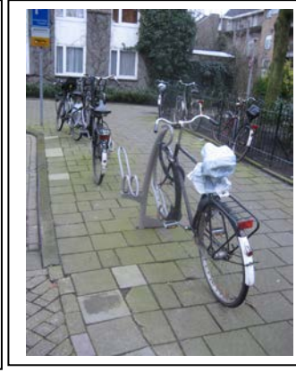
Fietsenrekken tulpmodel in Oud-West, geschikt