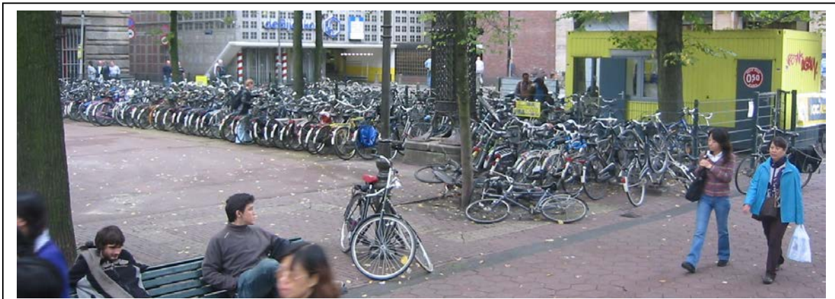
Beursplein: combinatie van betaald parkeren (achter het hek van de tijdelijke, weinig fraaie, Locker) en onbetaald parkeren.

Er zullen altijd bezoekers van de Bijenkorf en V&D blijven die niet bereid zijn om hun fiets op meer dan vijftig meter afstand te parkeren. In de hoek van de Dam bij de Bijenkorf moeten daarom fietsparkeervakken en/of fietsnietjes komen om de huidige fietsparkeerchaos te voorkomen. De tijdelijke Locker op het Beursplein is een goed initiatief, maar er is ook behoefte aan meer gratis fietsparkeerplaatsen.