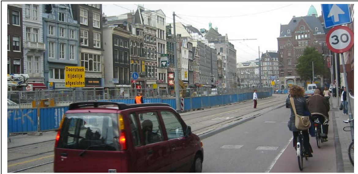
In het gedempte deel van het Rokin is voldoende breedte voor fietsparkeeroplossingen