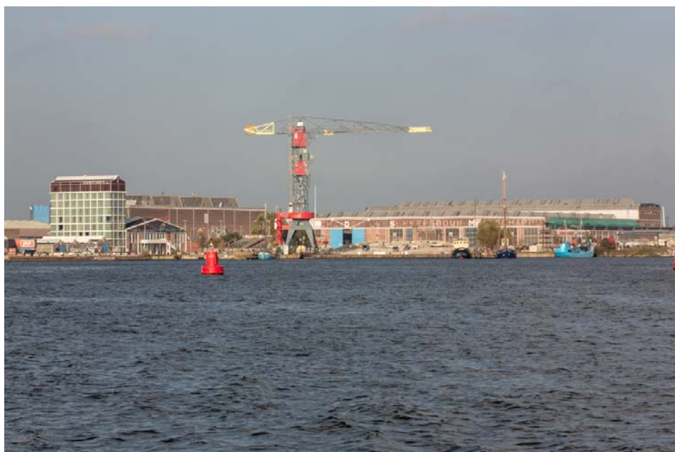
NDSM-terrein in Amsterdam-Noord, oktober 2015

Wat de mensen dan zullen gaan doen de hele dag dat weet ik nog steeds niet, maar ik hoop dat de stad Amsterdam haar inwoners plekken zal kunnen bieden die ongekaderd zijn, die ruimte bieden aan de nieuwe kunstbeleving zoals Baricco die voorstelt en die ruimte geeft voor perspectief zodat we ‘waardevolle keuzes kunnen maken’. En in mijn beleving is de NDSM – dit grote uitgestrekte en schijnbaar onbepaalde gebied – een plek die de stad juist datgene zou kunnen bieden.