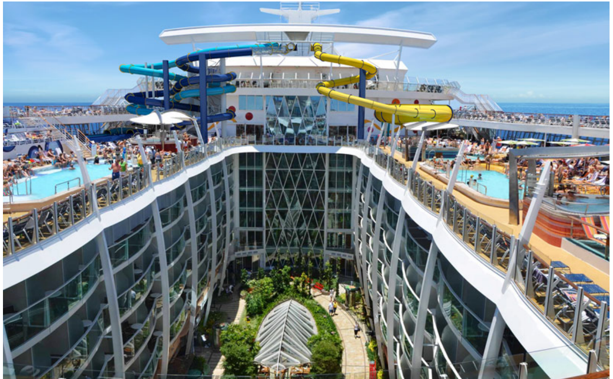
cruise schip Harmony of the Seas, 2016

Afgelopen weekend las ik in de Volkskrant een stuk over theatergroep Wunderbaum. Hun nieuwste voorstelling vindt plaats op een cruiseschip. De theatermakers boekten een reis op de Aida Prima, en vertellen over de onvergetelijke momenten die ze aan boord beleefden: het comfort, plezier en de eindeloze menukaart met heerlijk eten, 24-uurs entertainment en een royaal winkelasortiment.